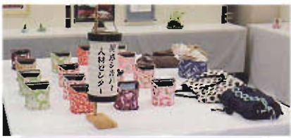
かいせい文化祭 出展作品