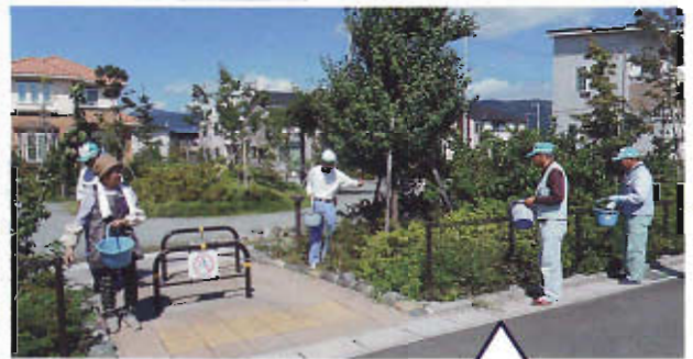
緑豊かな町の植木が元気に育つように肥料まき作業