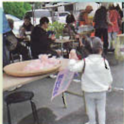
ボン菓子、くださいな!