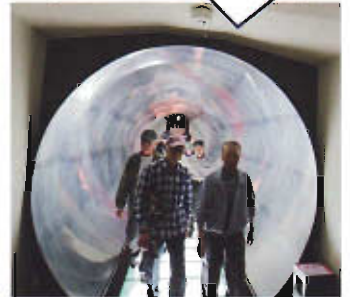
缶ビールの中を 通り抜けた先には お待ちかねの 生ビールがお出迎え