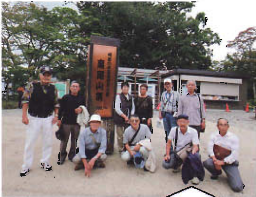
40分の山登り 残念ながら富士山は望めませんでしたが 久々に良い汗をかきました