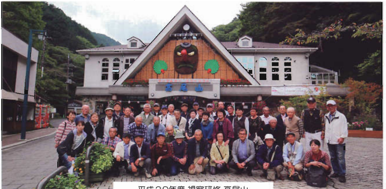
平成29年度 視察研修 高尾山