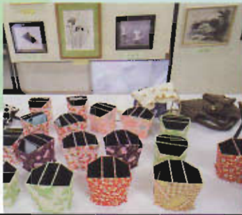
会員自慢の作品展