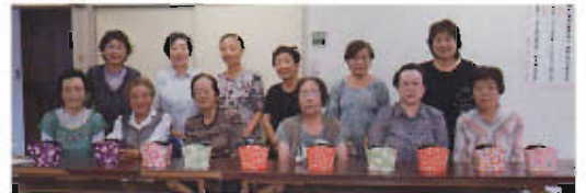
手芸グループの皆さん 個性豊かな、リモコボックスが 完成しました