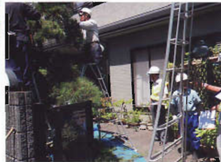
ヘルメットよし 装備よし！ 委員による安全パトロール