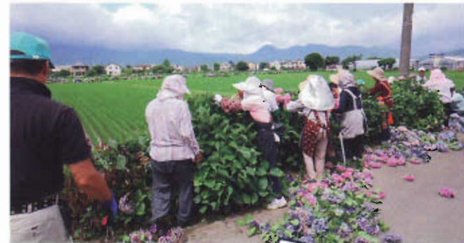
来年もきれいな花が咲くようにあじさい花柄摘みボランティア