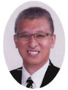
開成町 町長 府川 裕一