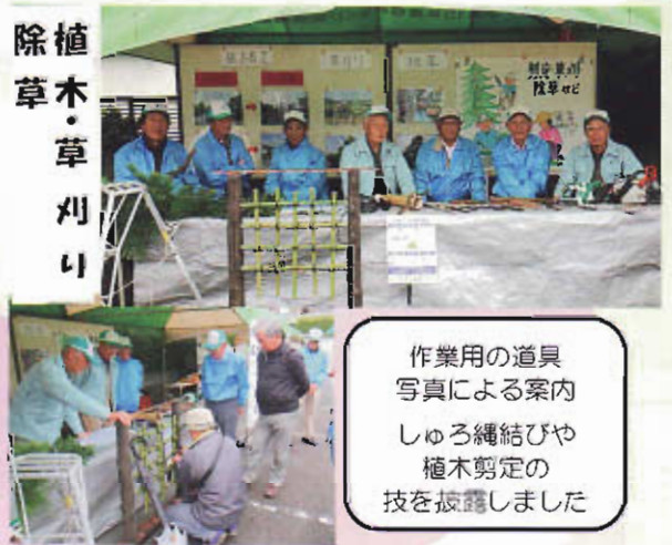
作業用の道具 写真による案内 しゅろ縄結びや 植木剪定の 技を披露しました