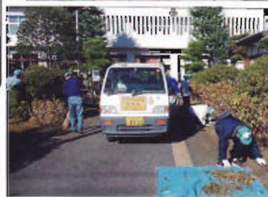
町の公共施設の除草と植木の剪定ボランティア