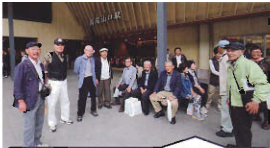
高尾山口駅周辺を散策 下山した会員と合流し深大寺へ