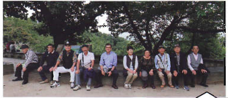
高尾山下山の前に 一休み