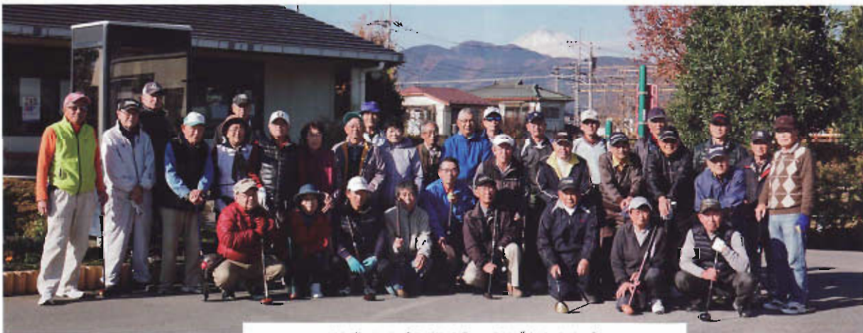
平成29年度 パークゴルフ大会