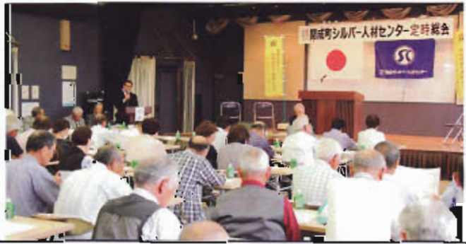
平成28年度決算、平成29年度予算審議：賛成多数で可決