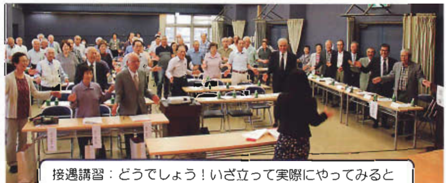
接遇講習：どうでしょう！いざ立って実際にやってみると楽しくなりませんか