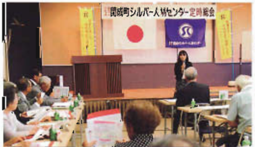
接遇講習：お辞儀と言葉はどちらを先にされていますか！考えてみましょう