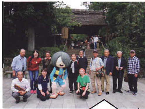
深大寺でゲゲの鬼太郎さんと 記念写真 鬼太郎生みの親、水木しげるさんは 昭和34年に調布市へ移り お住まいでした