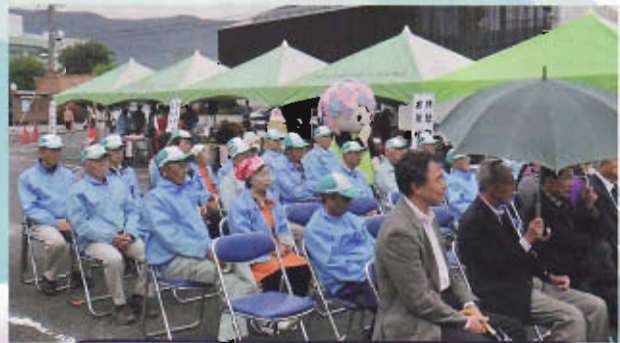
開会式に参加 ご来場の皆様と会員 あじさいちゃんも一緒に!