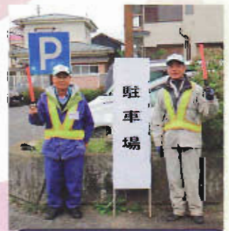
車でお越しの お客様をご案内