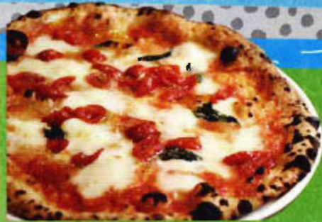
小麦作りから関わった 新窯焼きピZZA