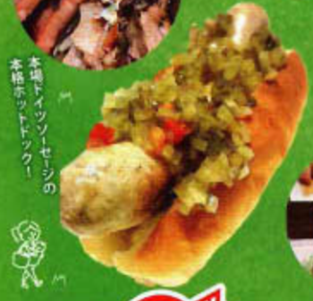
本場イタリアンセージの 本格ホットドッグ!