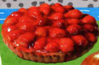
フランスの 伝統的な焼き菓子