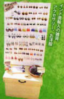
イベント参加者の福利 グッズあり。お土産