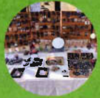
ハワイから来た パン屋さん