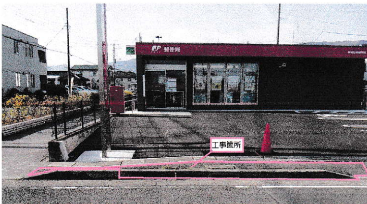
場所：開成駅前郵便局出入口（開成町吉田島 4354-1 先）