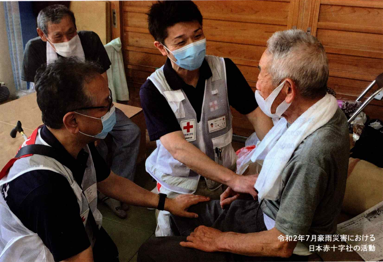
令和2年7月豪雨災害における 日本赤十字社の活動