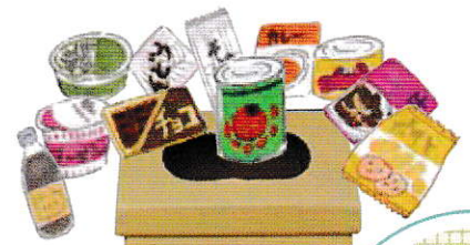
専用回収ボックス

寄贈された食品は、フードバンクかながわで管理し、行政・社協の相談窓口、地域のフードバンク等を通じて食料を必要とする人や、子ども食堂・母子支援施設などに届けます。 フードバンクかながわは、神奈川県生協・労働団体・JA・市民団体12団体により設立され食料支援活動を行っています。