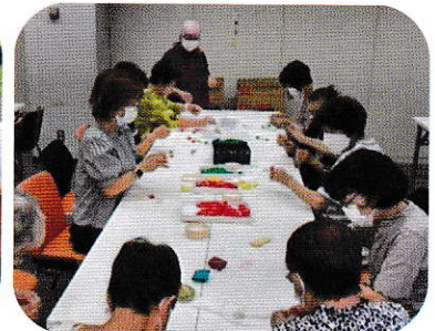
みんなで手際よく、折鶴仕上げ！