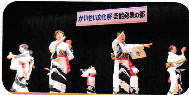
曲が素敵な「令和踊り」舞台での緊張感とホッとした写真の笑顔が素晴らしい！