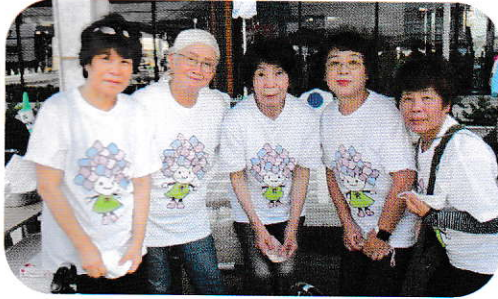
3年ぶりの阿波おどり！冷水サービスで、参加！