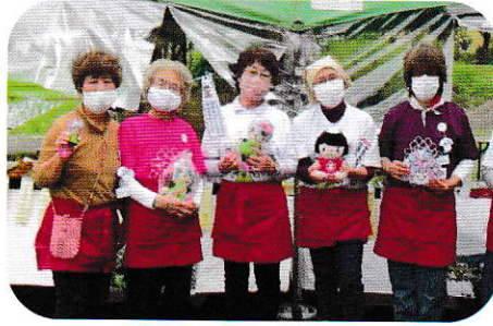
マスコットキャラクター、あじさいちゃんとキンタロウ