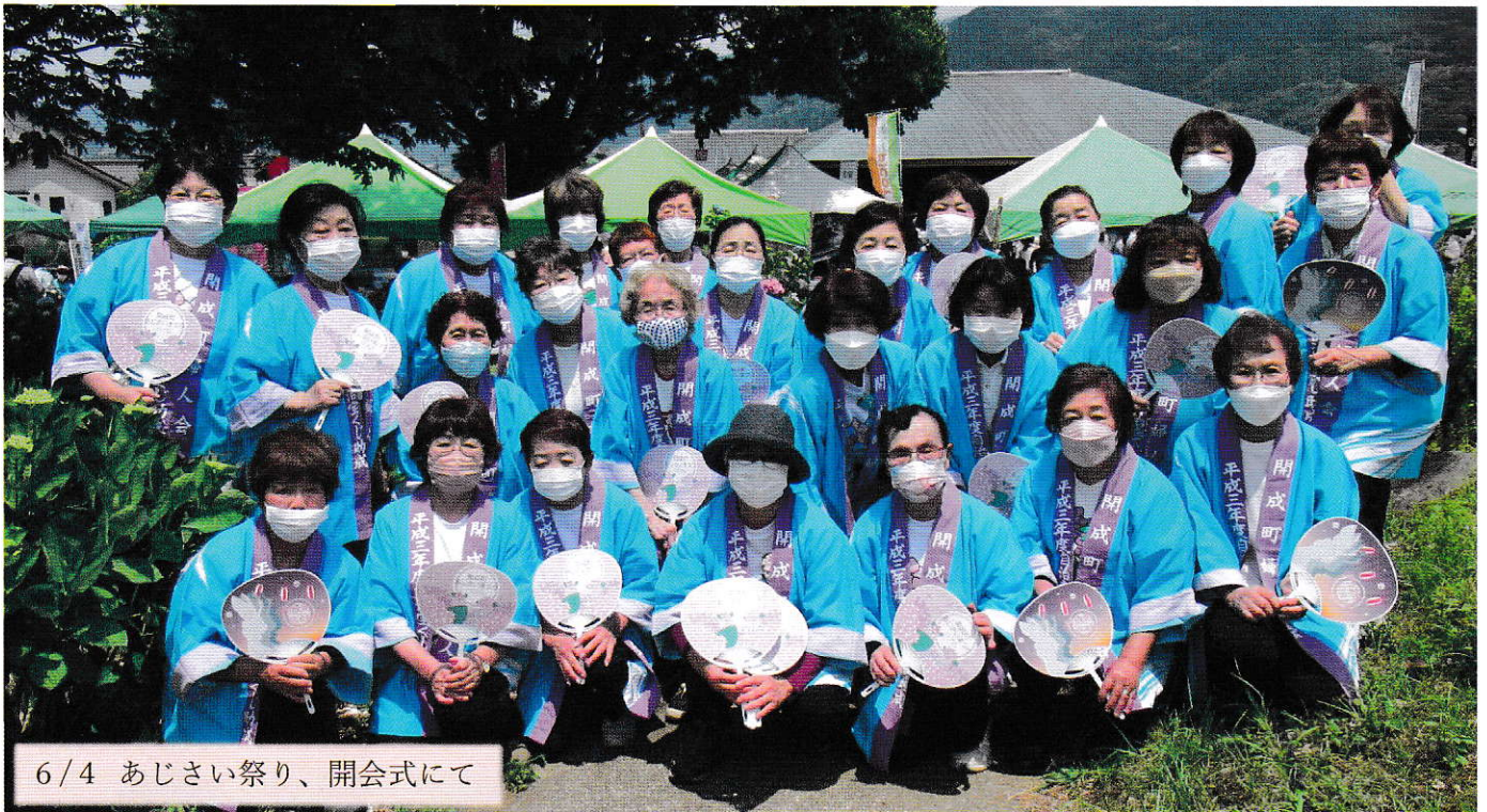
6/4 あじさい祭り、開成式にて