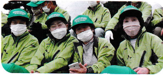
ねんりんピック、パークゴルフ会場で接待。