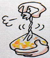
◎しっかりと空気を抜く