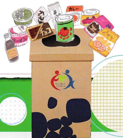
専用回収ボックス

寄贈された食品は、フードバンクかながわで管理し、行政・ 社協の相談窓口、地域のフードバンク等を通じて食料を必要 とする人や、子ども食堂・母子支援施設などに届けます。 フードバンクかながわは、 神奈川県生協・労働 団体・JA・市民団体 12団体により設立され 食料支援活動を行って います。