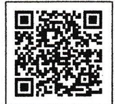
子ども神輿申込フォーム