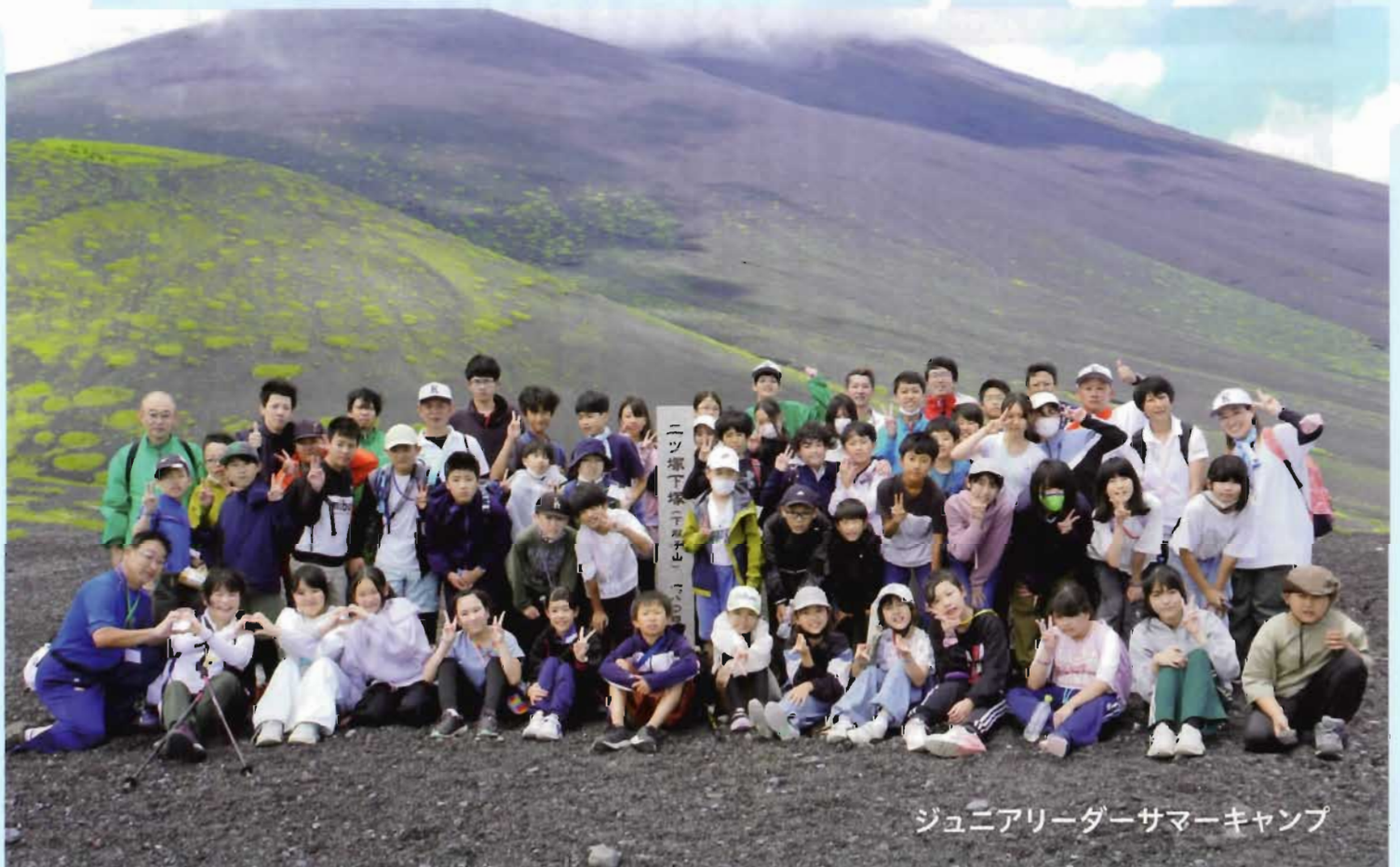
ジュニアリーダーサマーキャンプ